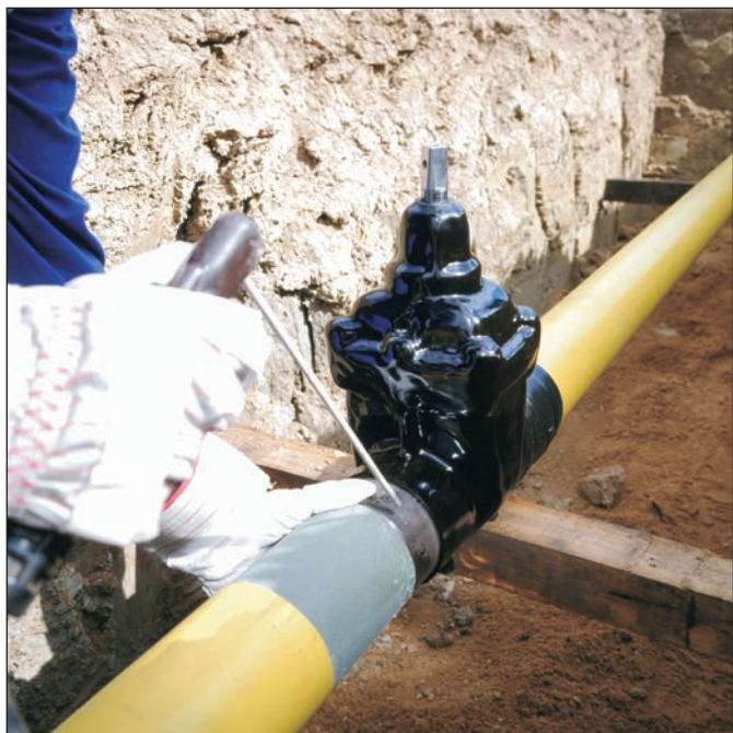
Свободный подход к стальным концам облегчает сварочные работы.